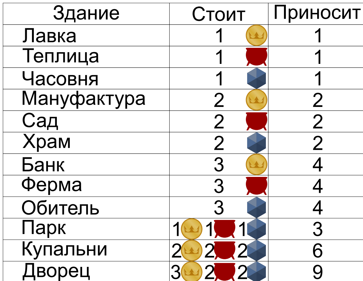
Таблица 1. Строительство зданий

5. Когда все поля, кроме города, будут заняты, строительство прекращается и начинается подсчёт очков. Победителем становится штаб, набравший наибольшее количество очков.